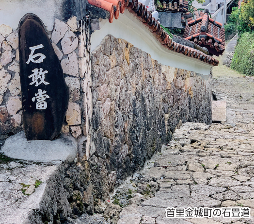
首里金城町の石畳道