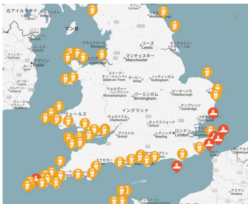
【図 1】 トリニティ・ハウスが管理する灯台・灯台船一覧

航行援助施設の設置、維持・管理のための資金は、英国内に寄港する船舶から徴収する一般灯標使用料（GLD）によって賄われている。GLD は、英国内に入港する船舶に課せられるもので、例えば曳船・漁船の年間支払額は、基本料金 190 ポンド（2026 年 3 月 5 日時点のレートで約 3 万 9,800 円）に加えて 10m を超える長さにつき 1m あたり 20 ポンド（同約 4,189 円）を積算した額であり、プレジャーボートのそれは、基本料金に加えて 77 ポンド（同約 1 万 6,129 円）である。その他の種類の船舶は、純トン数に単価 0.45 ポンド（同レートで約 94.26 円）を乗じる方式で算出されるが、計算上の重量上限は最大 5 万純トンであり、また、同一船舶による年