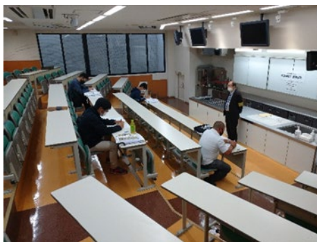
船舶料理士学科試験

「船員法」及び「船内における食料の支給を行う者に関する省令」に基づき、航海中に船員に支給される食料の調理が船内において行われる場合に、船内における食料の支給を適切に行う能力を有するものとして乗り組ませなければならない者が受有すべき船舶料理士資格証明書を取得するための、国土交通省の登録を受けた船舶料理士登録試験(学科試験及び実技試験)を実施。