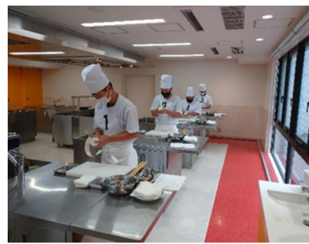
船舶料理士実技試験