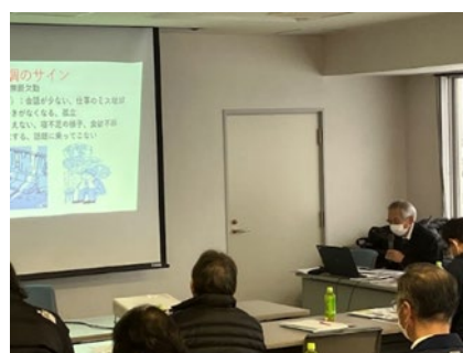
メンタルヘルス講習 (富山県漁連：新湊地区)