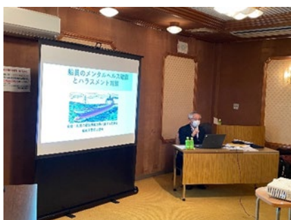
メンタルヘルス講習 (富山県漁連：黒部地区)

国土交通省の第11次船員災害防止基本計画を踏まえ、船員の衛生・健康に関する「高齢化対策」「メンタルヘルス対策」「生活習慣病対策」の3課題について、医師及び事業関係者からなる検討委員会により実態、原因、対応策を調査の上、作成した講習テキストを活用し講習会等の啓発活動を全国で実施。令和4年度は「生活習慣病対策」について新たに実施するとともに、令和2、3年度に開始した「高齢化対策」「メンタルヘルス対策」に係る講習会も継続。