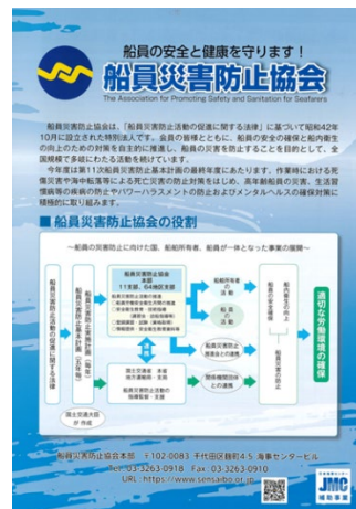
協会パンフレット