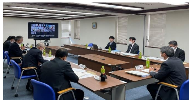
令和5年度国内委員会 (海上安全) 開催時の様子 (対面及びリモート方式を併用)

IMO (国際海事機関) のMSC (海上安全委員会)、MEPC (海洋環境保護委員会) 等の開催に際し、我が国の海事関係者・官公庁職員をメンバーとする国内委員会に対処方針を検討した。また、IMOの会議への参加等を通じて諸外国における海上安全及び海洋汚染防止に関する調査研究を行い、最新の情報を関係者に提供している。