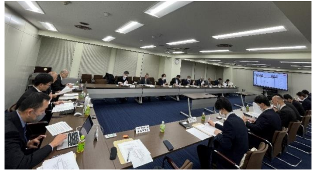
令和5年度第二回勉強会開催時の様子

有識者、関係機関、関係官庁を招集して勉強会を東京で2回開催し、勉強会を通じて「洋上風力発電事業に係る安全対策のガイドライン」の具体的方針の確認、ガイドライン骨子案策定等を実施し、勉強会内での資料、検討内容等を報告書として取り纏めた。