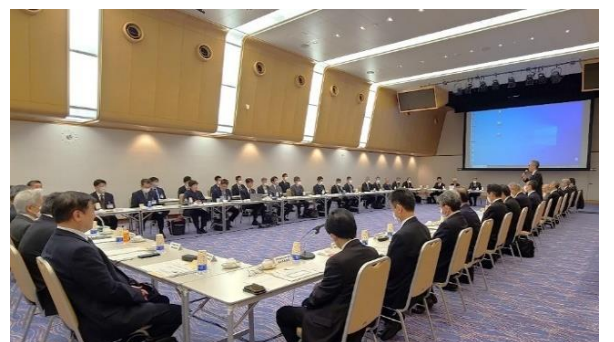
令和5年度全国海難防止団体等連絡調整会議 (年次会議)の様子

全国の海難防止団体、小型船安全協会等の関係者からなる全国海難防止等連絡調整会議を継続して設置し、年次会議を開催するとともにWeb会議によるフォローアップを行って、海難防止等に関する調査研究及び周知・啓蒙活動等に係る相互調整及び情報交換を実施した。