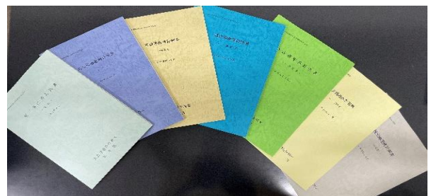
港湾計画資料 (改訂・一部変更)

学識経験者や地方を統括する団体等からの海事関係者、関係官庁等から構成される「港湾専門委員会」を設置し、令和5年度は1回の「港湾専門委員会」を開催、7の港湾計画の改訂・一部変更を対象に検討、1の港湾については資料送付を実施した。