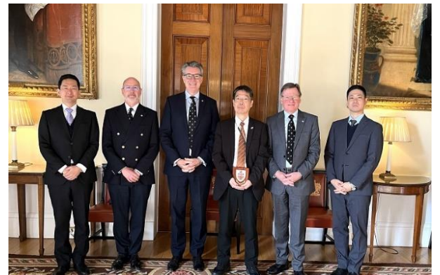
航路標識を管理する英国 Trinity House との情報収集・意見交換

また、海上安全に関する欧州等の国際的な動向の調査・研究を進めるとともに、公開セミナーの開催（テーマ：「無人船と海上保安活動」）、「X（旧ツイッター）」の活用等により、各国関係機関・団体とのネットワークを拡大するとともに、情報発信を強化した。