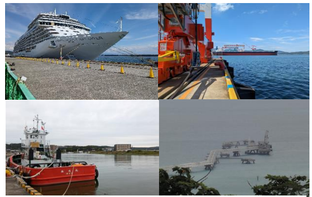
現地調査時の写真 (上左: 高知港、上右: 伊万里港 下左: 網走港、下右: 金武中城港)