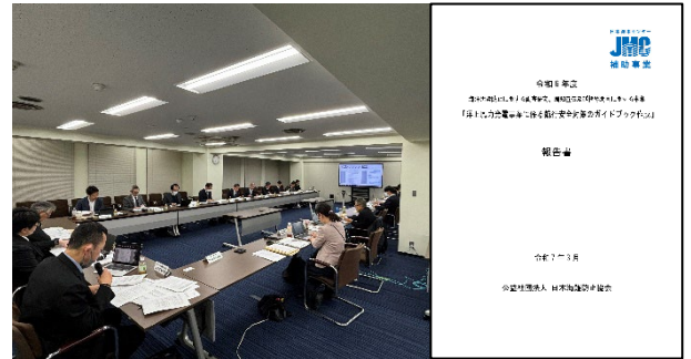
令和6年度第一回勉強会開催時の様子と報告書

有識者、関係機関、関係官庁を招集して検討会を東京で2回開催し、「洋上風力発電事業に係る安全対策ガイドブック」を策定、検討内容等を報告書として取り纏めた。