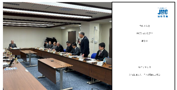
令和6年度第三回港湾専門委員会の様子と報告書

学識経験者や地方を統括する団体等からの海事関係者、関係官庁等から構成される「港湾専門委員会」を設置し、令和6年度は3回の「港湾専門委員会」を開催、8の港湾計画の改訂を対象に検討を実施した。