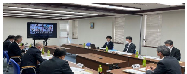
令和6年度国内委員会（海洋汚染）開催時の様子（対面及びリモート形式を併用）

IMO（国際海事機関）のMSC（海上安全委員会）、MEPC（海洋環境保護委員会）等の開催に際し、我が国の海事関係者・官公庁職員をメンバーとする国内委員会で対処方針を検討した。また、IMOの会議への参加等を通じて諸外国における海上安全及び海洋汚染防止に関する調査研究を行い、最新の情報を関係者に提供している。