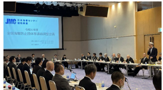
令和6年度全国海難防止団体等連絡調整会議（年次会議）の様子

全国の海難防止団体、小型船安全協会等の関係者からなる全国海難防止等連絡調整会議を継続して設置し、年次会議を開催するとともにWeb会議によるフォローアップを行って、海難防止等に関する調査研究及び周知・啓蒙活動等に係る相互調整及び情報交換を実施した。