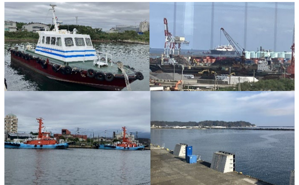
現地調査時の写真（上左：パイロットボート、上右：入港中のLNG船、下左：曳船、下右：宮古港）