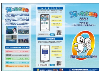
リーフレット（三つ折り）

(5) 令和6年度海の安全運動の啓発活動で使用するリーフレット、グッズを作成した。