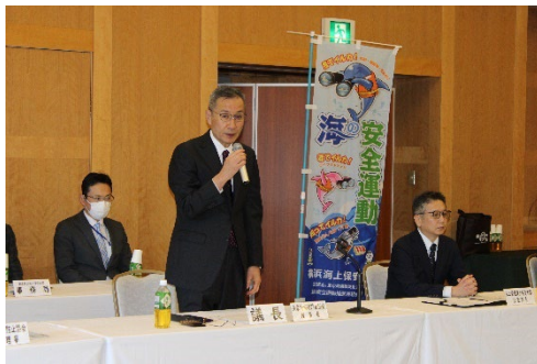
海の安全運動推進連絡会議開催状況①

(2) 海の安全運動推進連絡会議を2回開催し、第1回会議（令和6年10月開催）にキャンペーンの進捗状況を確認し、第2回会議（令和7年2月開催）に令和7年度海の安全運動実施計画を策定した。