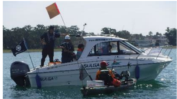
ミニボートに対する安全指導

(2) 海の安全運動推進連絡会議を2回開催し、第1回会議（令和6年10月開催）にキャンペーンの進捗状況を確認し、第2回会議（令和7年2月開催）に令和7年度海の安全運動実施計画を策定した。