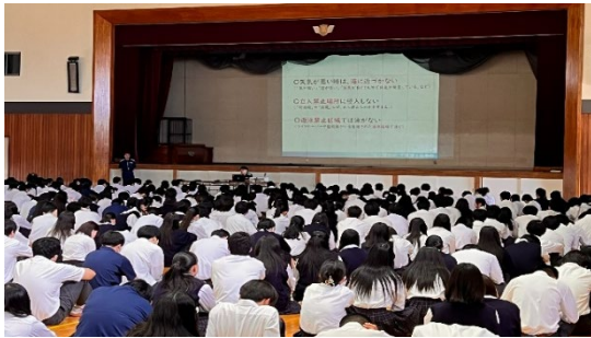
高等学校における安全教室（出前授業）