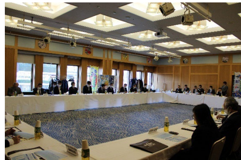
海の安全運動推進連絡会議開催状況②

(3) 令和6年度海の安全運動において貢献度が高いと判定された、千葉県教育委員会、㈱「エフエム熱海湯河原」及び下田海中水族館について、3月19日に表彰委員会を開催し、海の安全運動推進連絡会議の議長表彰を行った。