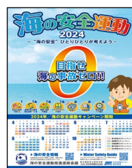
ポスター（年間スケジュール、霧、台風事故ゼロキャンペーン）