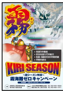
【霧海難ゼロキャンペーンポスター】

海難防止強調運動推進東海地方連絡会議を主催し、霧海難ゼロキャンペーン（4/2～7/31）、海の事故ゼロキャンペーン（7/16～7/31）を推進した。海の事故ゼロキャンペーンでの活動は、①ポスターの掲示、②海の事故ゼロキャンペーンの啓発、③テレビでの広報活動、④ラジオでの広報活動、⑤広報誌への掲載、⑥集客施設での広報活動、⑦イベントでの啓発活動、⑧地域と連携した啓発活動、⑨海上安全教室、⑩安全パトロールに大別され、各団体・機関が各地区で展開した。