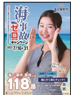
【事故ゼロキャンペーンポスター】