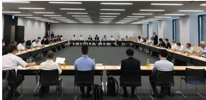
【東海地方連絡会議の開催状況】