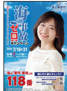
【事故ゼロキャンペーンポスター】