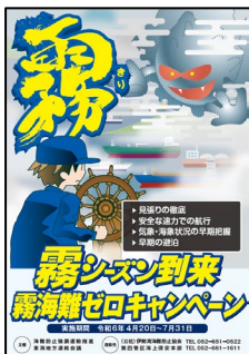
【霧海難ゼロキャンペーンポスター】

海の事故ゼロキャンペーン活動では、①ポスターの掲示、②ラジオでの広報活動、③広報誌への掲載、④集客施設での広報活動、⑤海上安全教室、⑥海難防止講習会、⑦イベントでの啓発活動、⑧安全パトロールに大別され、各団体・機関が各地区で展開した。