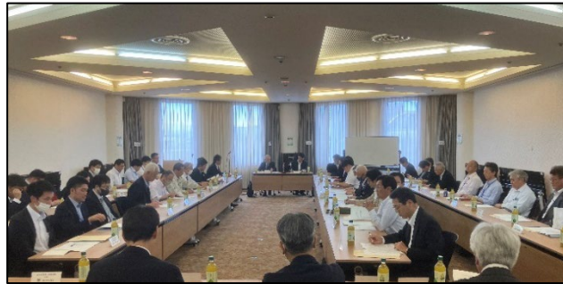
【東海地方連絡会議の開催状況】