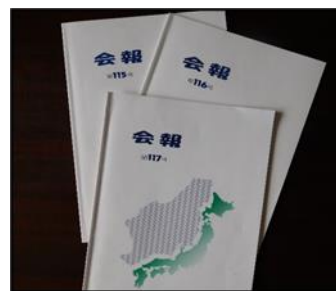
会報 年3回発行 日本海海難防止協会HP参照 http://nikkaikb.com/