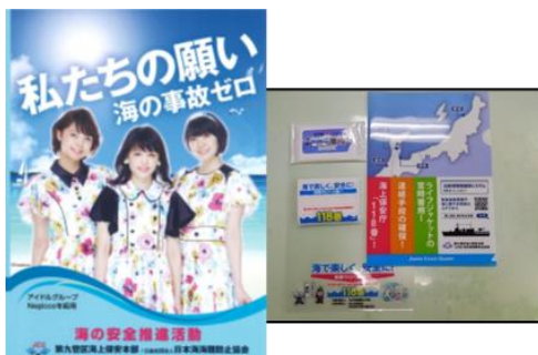
ポスター、グッズ類

また、当協会の業務や海難防止に関する連絡事項などを掲載した会報を年3回発行し、海難防止や海上交通安全への関心を高めることを実施した。