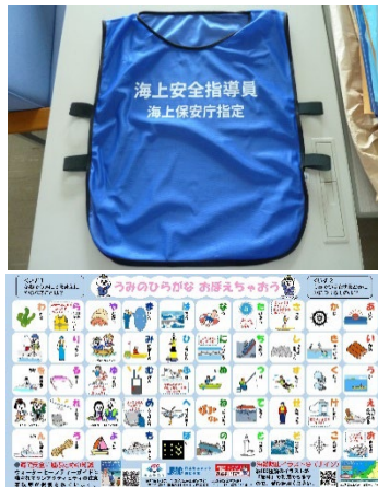
ポスター、グッズ類