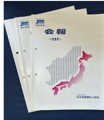
会報 年3回発行 日本海海難防止協会HP参照 http://nikkaikb.com/