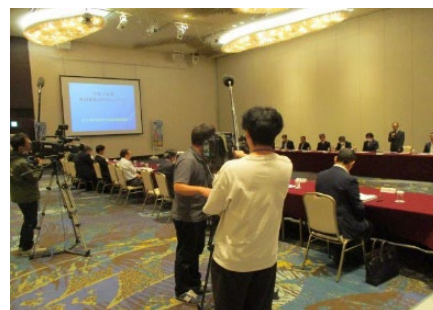
【報道機関による取材の様子】

海難防止思想の普及・高揚に関するポスター・グッズ等の作成、配布を行うとともに地方海難防止強調運動推進連絡会議を開催し、関係機関と連携して海難に対する意識を高め、事故の未然防止に繋げている。(日本海中部地方海難防止強調運動推進連絡会議を報道機関へ公開し、地域の皆様に広く啓発したことにより、効果的な海難防止活動となった。)