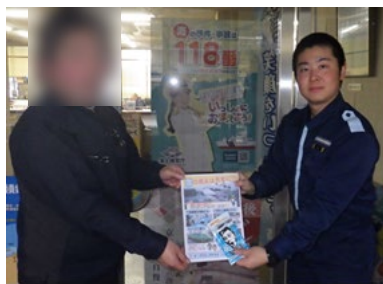
【啓発用グッズの配布】