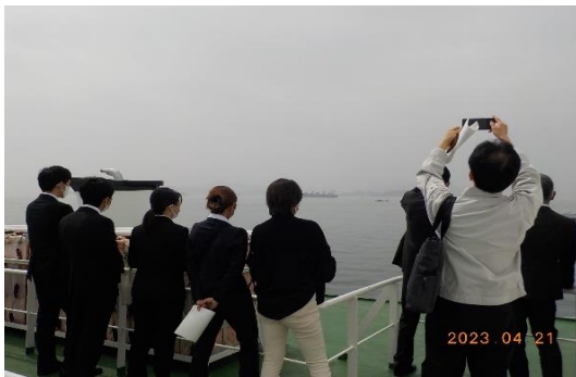
こませ網漁船相互体験乗船調査

備讃瀬戸海域に関係する荷主、船主、水先人・船長など海運側ステークホルダーと、航路付近を主な漁場として活動するこませ網漁業関連団体、漁業協同組合、漁業従事者など水産側ステークホルダー、学識経験者、第六管区海上保安本部等関係行政機関、地方自治体等が一堂に会し、連携して安全対策の共創と相互理解の促進に向けた活動を通じた同海域の現状を把握するための官民一体の事業「海上交通安全調査研究事業」を実施した。