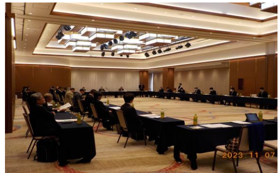
第24回備讃瀬戸交通安全調査委員会