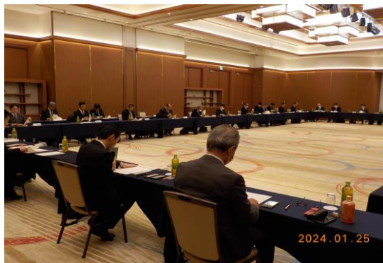
第25回備讃瀬戸交通安全調査委員会