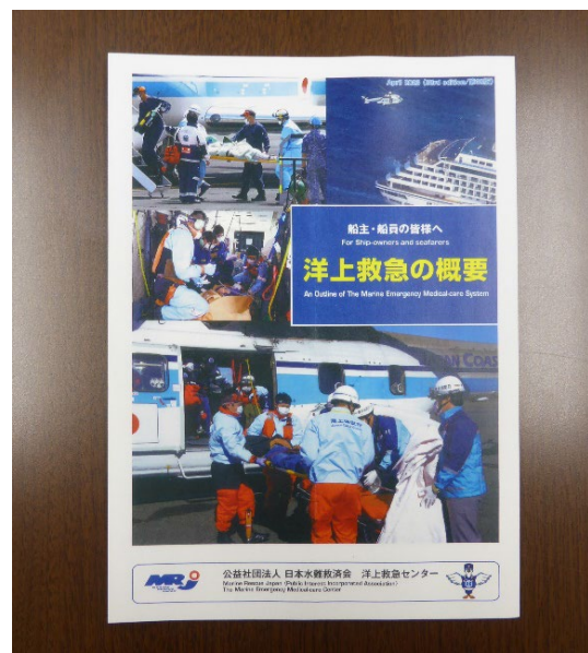
成果物の「洋上救急の概要パンフレット」