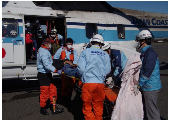
傷病者を海上保安庁ヘリから救急車へ引継ぎ