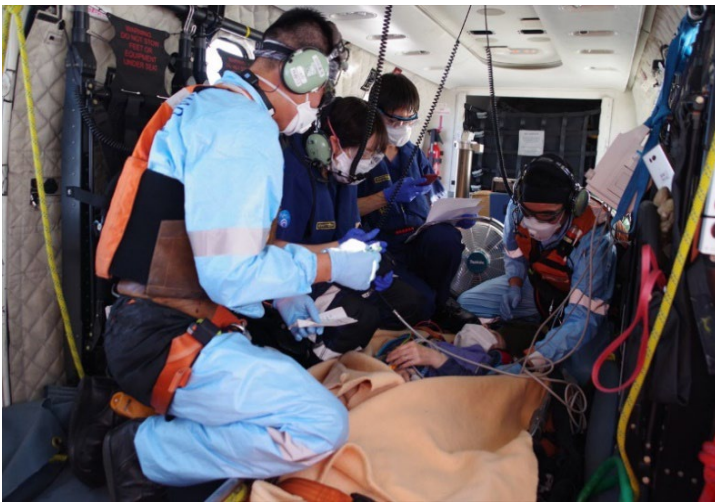
ヘリコプター内での応急処置

なお、令和4年度の洋上救急出動件数は13件、救助人数13人で、昭和60年10月洋上救急制度発足以来の累計出動件数は966件、救助人数999名となっている。