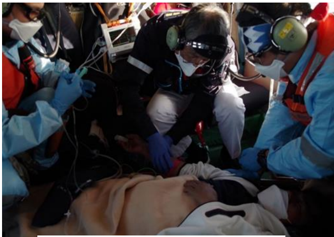
ヘリコプター内での応急処置

なお、令和5年度の洋上救急出動件数は19件、19名で、昭和60年10月洋上救急制度発足以来の累計出動件数は986件、救助人数1,019名となっている。