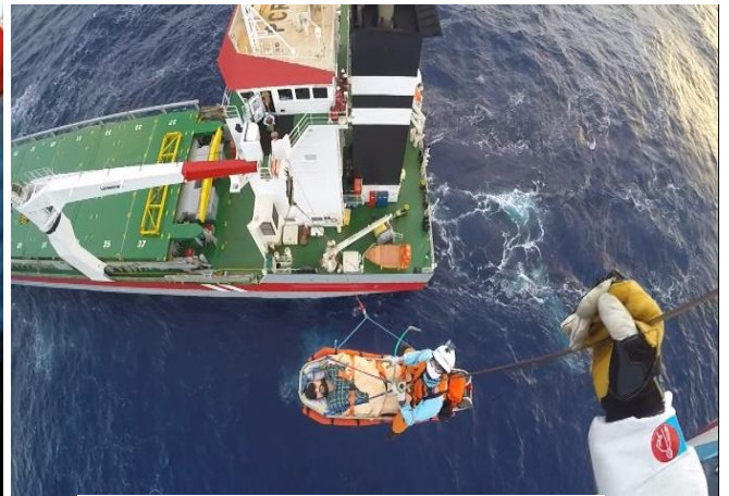
ヘリコプターへの傷病者収容作業