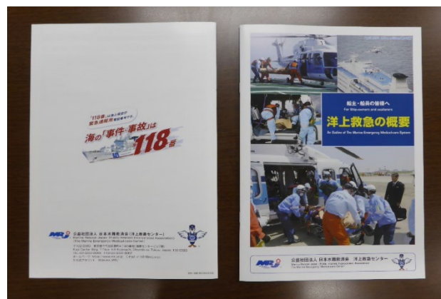
成果物の「洋上救急の概要パンフレット」