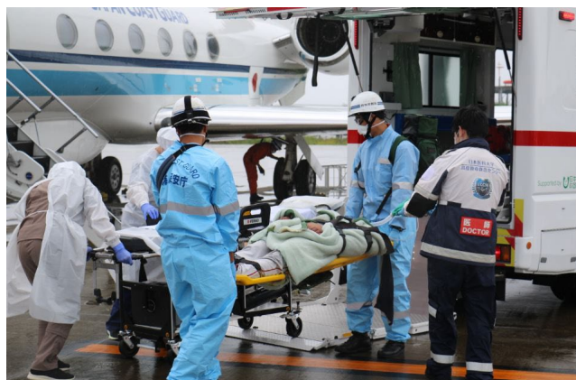
傷病者を陸上の病院へ搬送作業