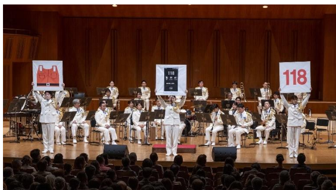
自己救命策3つの基本を呼びかけ

各国大使をはじめ約1600人の来場者やライブ配信の視聴者に、「海」をテーマにした楽曲の演奏とともに、音楽隊員が「自己救命策3つの基本」である救命胴衣の着用、連絡手段の確保、海の緊急通報用番号「118番」を呼びかけ、海難の防止等海上保安活動の啓発を図った。