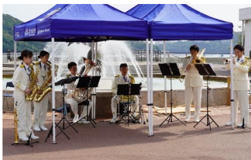
鳥羽市佐多浜東公園での演奏

午前は鳥羽市佐多浜東公園、午後は旅客船ターミナル「鳥羽マリンターミナル」においてアンサンブルコンサートを開き、伊勢志摩の海上交通の安全を担っている菅島灯台及び安乗埼灯台の役割、海の緊急通報用番号「118番」などを紹介し、来場者に海事思想の普及及び航行の安全確保、海難の防止等海上保安活動の啓発を図った。