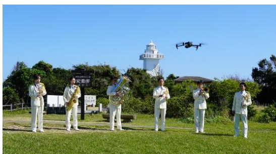
音楽隊員による演奏