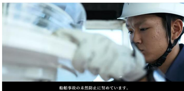
鳥羽海上保安部職員による灯台整備の状況