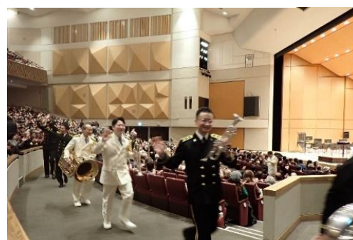
両音楽隊員が客席を通過して退場