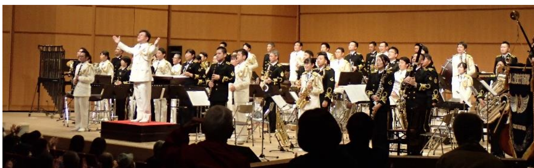
海上保安庁音楽隊×海上自衛隊舞鶴音楽隊による合同演奏

舞鶴総合文化会館大ホールで開かれたコンサートには、鴨田秋津 舞鶴市長、海上自衛隊舞鶴地方総監 下 淳市海将、海上保安庁第八管区海上保安本部 筒井直樹本部長も来場。両音楽隊の迫力ある合同演奏や業務紹介パネルの展示等を通じて、約1200人の観客に、両機関の活動や連携に対する理解を深めるとともに、海上保安活動の重要性について啓発する有効な機会となった。