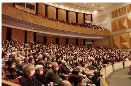
舞鶴市民ら約1200人が来場