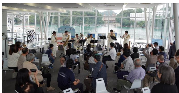
演奏を通じて海上保安活動を啓発 (鳥羽マリンターミナル)