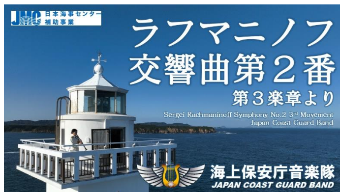
演奏動画サムネイル

演奏動画掲載 URL : https://www.youtube.com/watch?v=XbRfZuEAS-U